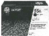
Cartucho de tóner HP P3010 LaserJet, negro (PCL6) (S/. 445.00 precio aprox.)