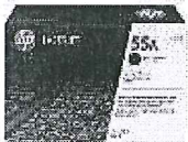
Cartucho de tóner HP P3010 LaserJet, negro (PCL6) (S/. 445.00 precio aprox.)