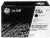
Cartucho de tóner HP P3010 LaserJet, negro (PCL6) (S/. 445.00 precio aprox.)