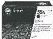
Cartucho de tóner HP P3010 LaserJet, negro (PCL6) (S/. 445.00 precio aprox.)