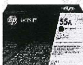
Cartucho de tóner HP P3010 LaserJet, negro (PCL6) (S/. 445.00 precio aprox.)