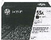
Cartucho de tóner HP P3010 LaserJet, negro (PCL6) (S/. 445.00 precio aprox.)