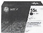
Cartucho de tóner HP P3010 LaserJet, negro (PCL6) (S/. 445.00 precio aprox.)