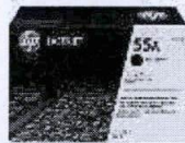
Cartucho de tóner HP P3010 LaserJet, negro (PCL6) (S/. 445.00 precio aprox.)