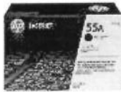
Cartucho de tóner HP P3010 LaserJet, negro (PCL6) (S/. 445.00 precio aprox.)