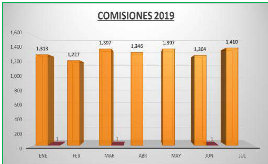
Gráfico N° 09