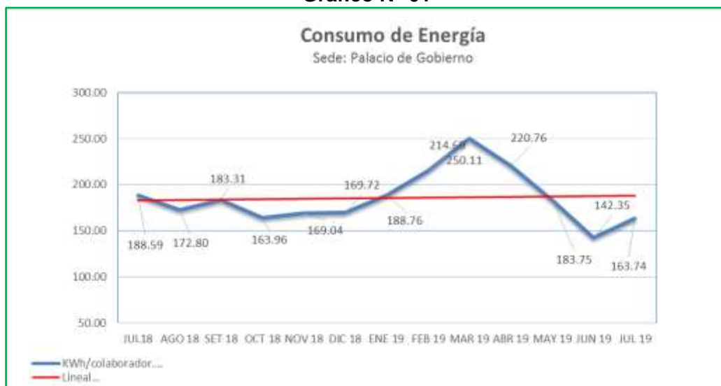
Gráfico N° 01

Se muestra el Gráfico N° 01: Consumo de energía, sede, Palacio de Gobierno: