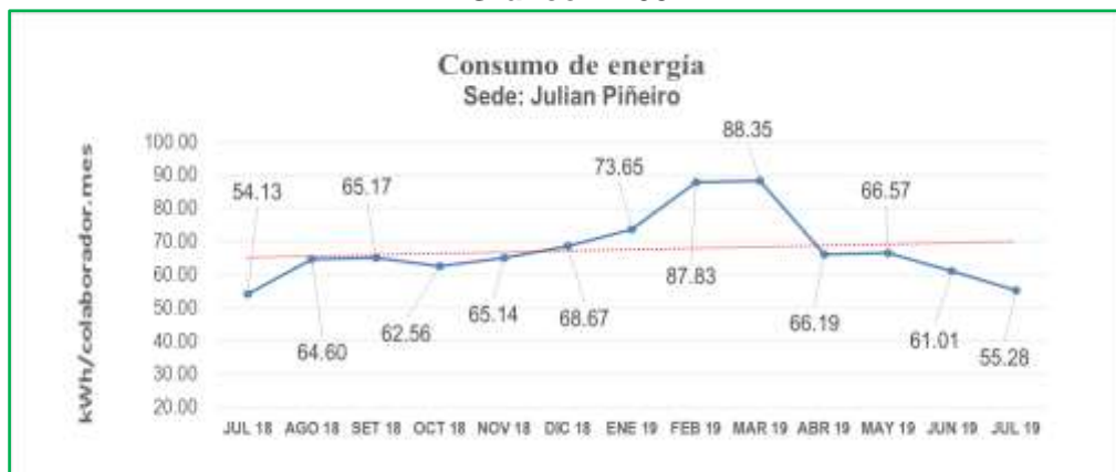
Gráfico N° 03

Si comparamos el mes de julio 2019 respecto a su similar de 2018 se observa un incremento del 2.12%, y un ahorro de 9.39% respecto al mes anterior del presente año, se espera un mayor ahorro con el cambio de clima.