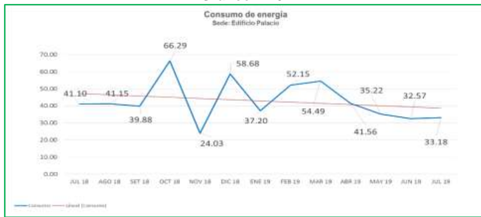
Gráfico N° 02

Si comparamos el consumo de mes de julio de 2019 respecto al mismo mes del año anterior 2018, se observa un ahorro del 19.27%, y un ligero incremento de 1.86%, respecto al anterior del presente año, estos resultados son generados por dos factores como es la migración de un significativo número de servidores desde las instalaciones del Edificio Palacio hacia el monumento histórico y el segundo factor es debido al cambio de clima.