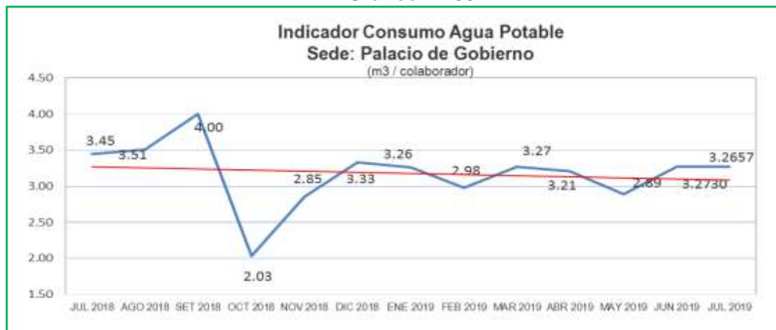
Gráfico N° 05

Al evaluar el indicador del mes de julio respecto al mes anterior, ambos de 2019, se observa que hay un ahorro ascendente al 0.22%, esto se debe a las condiciones climáticas y a la reducción del uso de las duchas, Ver Gráfico N° 05.