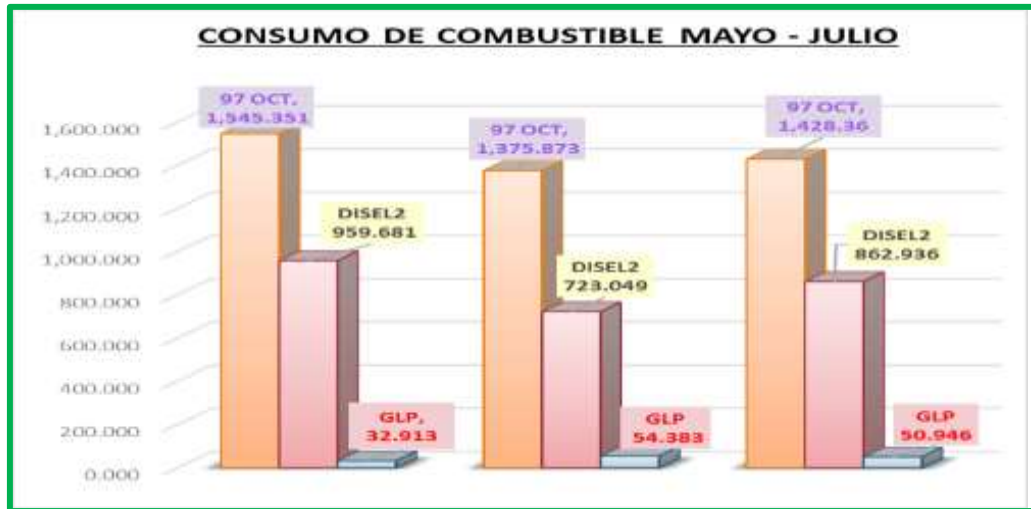
Gráfico N° 08

f) En lo relacionado a las comisiones de servicio (Cuadro N° 02) ejecutadas durante el mes de julio, observamos un incremento de 8% en relación al mes anterior, es decir 106 comisiones más.