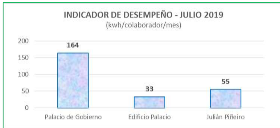
Gráfico N° 04

Asimismo, al analizar el indicador de desempeño de consumo de energía eléctrica mensual por colaborador, se evidenció que el mayor consumo de energía eléctrica en el mes de julio de 2019, se dio en el Palacio de Gobierno, equivalente a un 65% del total de energía consumida por el Despacho Presidencial (gráfico N° 04).