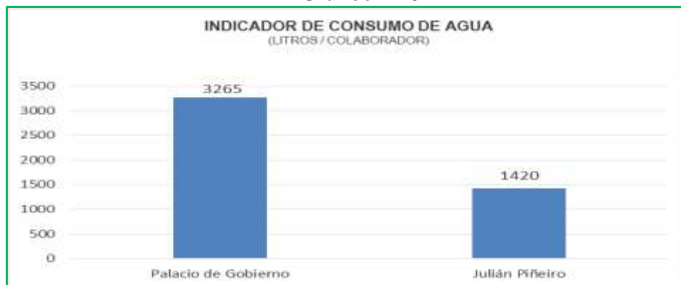
Gráfico N° 07

Finalmente, al analizar los consumos, según Gráfico N° 07, por persona en las sedes Palacio de Gobierno y Julián Piñeiro, encontramos que el consumo en el monumento histórico es superior. Esto resulta evidente, puesto que la cocina y la mayor población se encuentran en dicha sede, donde el uso del líquido elemento es mayor.