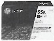
Cartucho de tóner HP P3010 LaserJet, negro (PCL6) (S/. 445.00 precio aprox.)